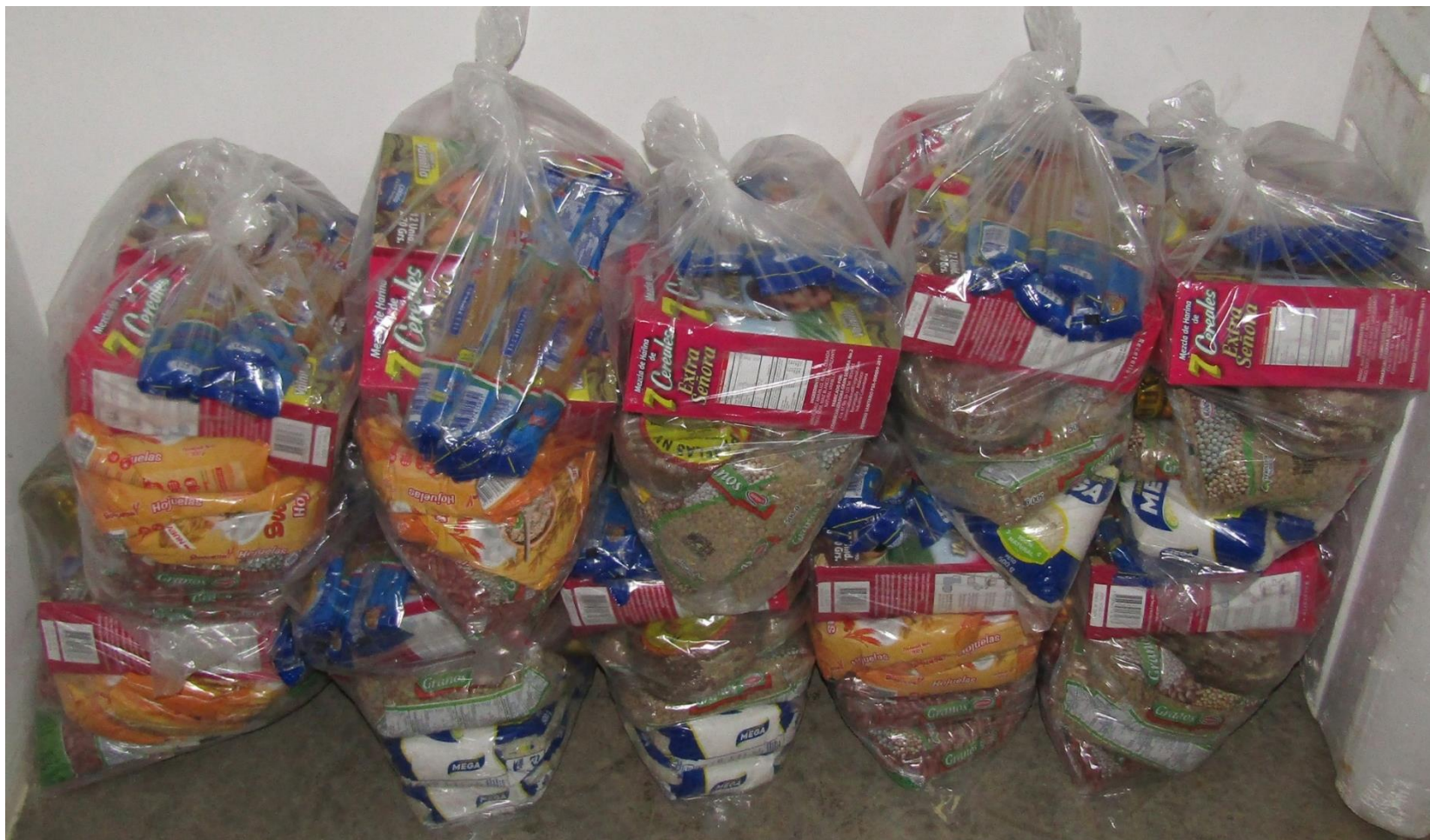
Paquetes de complementación alimentaria