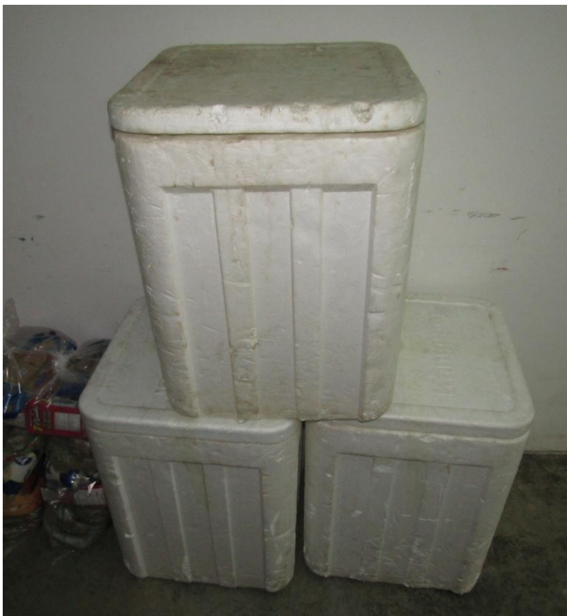
Cavas de pescado congelado donado por el restaurante Don Juan