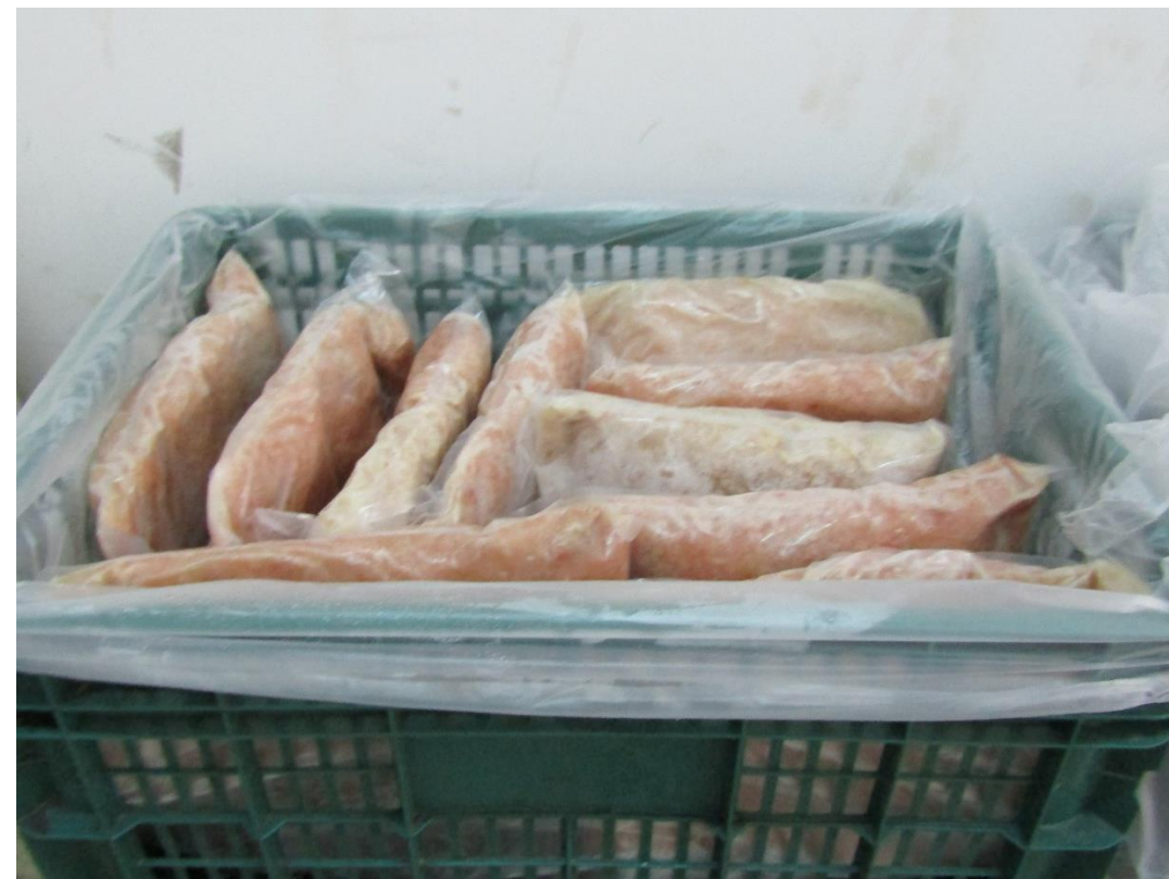
Pescado molido congelado donado por el restaurante Club de Pesca